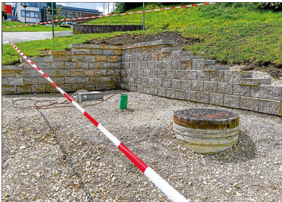
Schöne Ecke: Der Platz für den neuen „Obere Talbrunnen“ (im Hintergrund das Rathaus) in Meßstetten ist weitgehend fertig. In der ersten Juni-Woche soll der Brunnen aufgestellt werden.

Der Brunnen besteht aus 8 Millimeter dickem Stahlblech. Das Becken, es ist etwa ein auf zwei Meter groß, ist feuerverzinkt und auf Epoxidharz-Basis duplexbeschichtet. Das garantiert absolute Wasserdichtheit. Der zweite Teil des Brunnens ist der sogenannte Brunnenstock. Dieser kommt von einer Schweizer Spezialfirma und wird stirnseitig – ohne direkte Verbindung – neben den Brunnentrog platziert. Die veranschlagten Gesamtkosten in Höhe von rund 12.000 Euro wurden eingehalten. (VB)