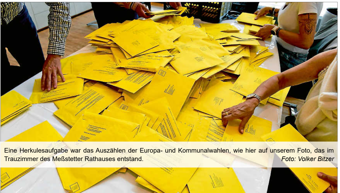
Eine Herkulesaufgabe war das Auszählen der Europa- und Kommunalwahlen, wie hier auf unserem Foto, das im Trauzimmer des Meßstetter Rathauses entstand.